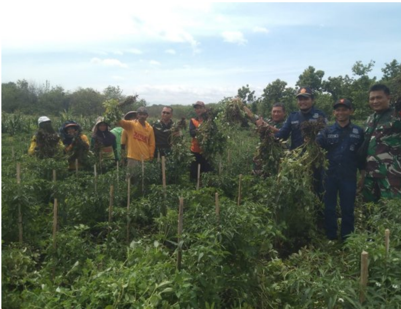
Dandim 0804/Magetan Bersama Dinas Perhutani Melaksanakan Peninjauan Perluasan Area Tanam