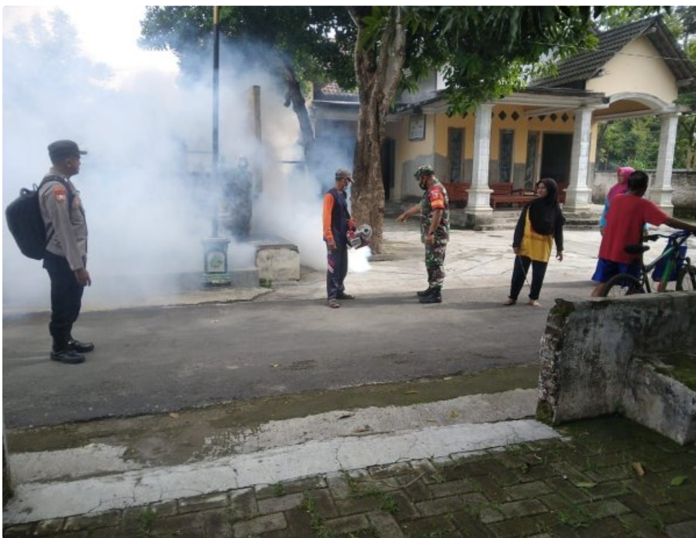
Bati Tuud Koramil 0804/08 Barat Basmi Sarang Nyamuk Bersama Petugas Fogging