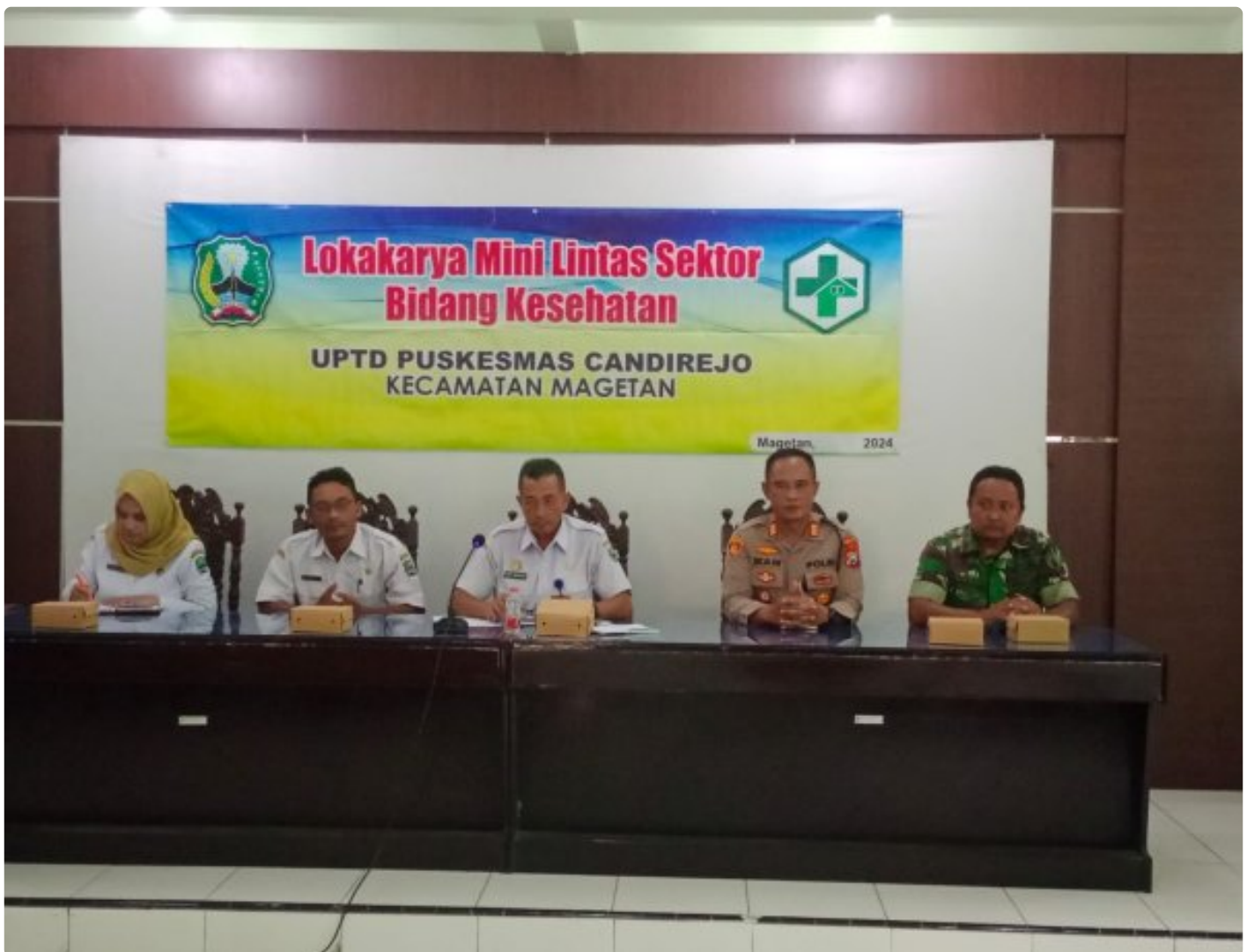
Bati TUUD Koramil 0804/01 Magetan Hadiri Loka Karya Mini Lintas Sektor Tri Bulanan Bidang Kesehatan

MAGETAN. - Bati TUUD Koramil Tipe B 0804/01 Magetan Kodim Magetan Pelda