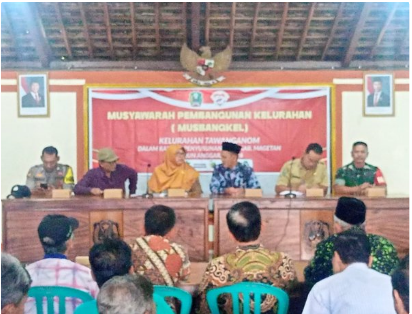
Babinsa Koramil 0804/01 Magetan Hadiri Musrenbang di Kelurahan Tawanganom